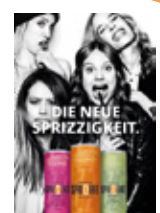
1x Poster A2