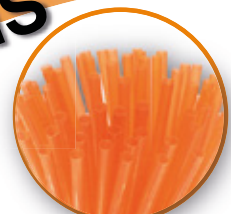
250 x Sprizzerò- Trinkhalme