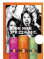
2 x Acryl- Aufsteller (A6)