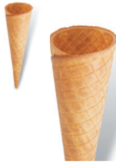
300273 Jonny, mR, Gk

Länge 173 mm, ø 100 mm, süß 180 St. im Kt.