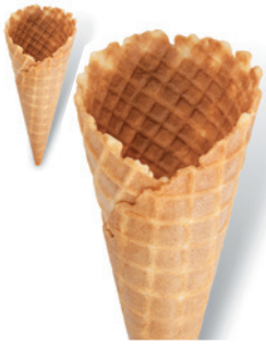
300269 Sunny oR, Gk

Länge 140 mm, ø 55 mm, süß 320 St. im Kt.